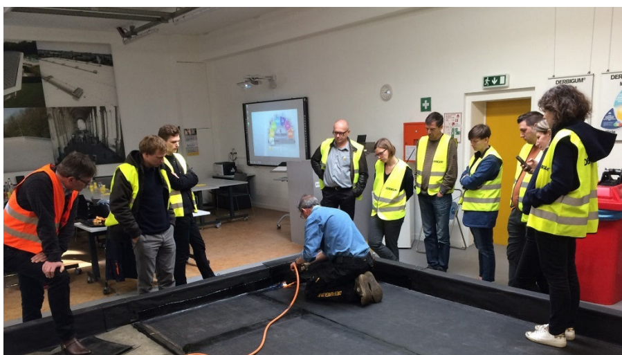
Formation pour architectes au Training Center à Lot

Faciliter les choses commence à la base. C'est pourquoi, Derbigum organise régulièrement des sessions de formation spécifiques pour architectes. Tous les points d'attention importants pour les toitures plates sont repris dans une formation complète et concise. L'Ordre des Architectes accorde, d'ailleurs, des points aux architectes qui suivent cette formation.